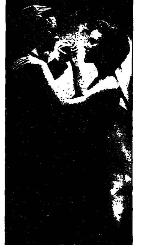
مشهد من أحد أفلام

مذ أن ظهر للفن الأمريكي الشهير مايكل دوغلاس عشيقا لشارون ستون في فيلم «الغريزة الأساسية»، لم تتوقف الصحافة وخصوصا الفضائية عن ترويج مختلف أنواع الشائعات عنه، واخرها ان الممثل المذكور يخضع لعلاج إزالة التسمم الجنسي أي مرض افراط في ممارسة الجنس حول هذه النقطة تحدث للممثل داحضا مثل هذه الشائعات التي لا اساس لها من